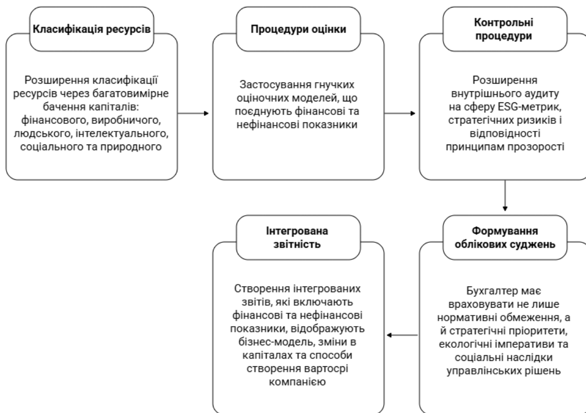
Рис. 2. Напрями трансформації облікової системи в наслідок впровадження концепції інтегрованого мислення